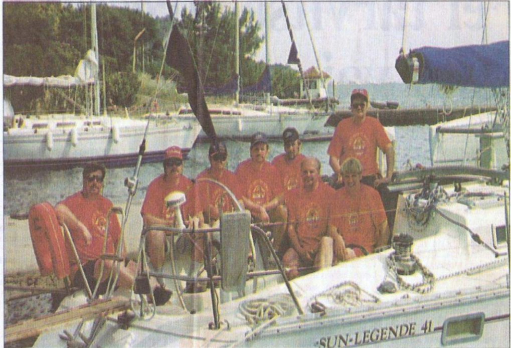
Voittajien on helppo hymyillä.

— Perjantaina päästiin taas itse asiaan eli kilpapurjehdukseen. Päivä oli lähes tiistain toisinto niin keleineen kuin palkintosijoineenkin, sillä