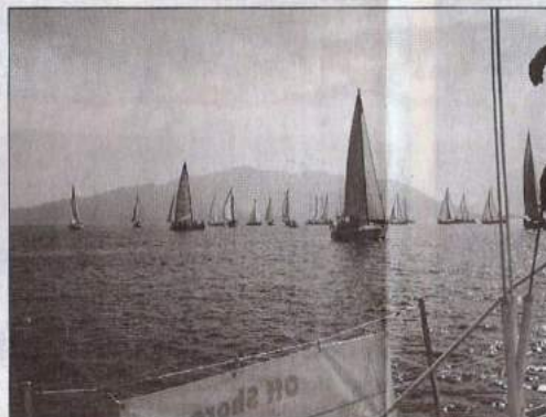
Isot veneet odottamassa lähtöpaukkua Marmaris-lahdella.

Pokaaleita kertyi heipsiläi-sille vain yksi, 36:n kolmas si- ja avomerikisassa. Kisaviikon kokonaistuloksissa 36:nen si-joittui 10. sijalle ja 44:nen 8:nneksi. Epäviralliset sijoitukset olivat kuitenkin paremmat, kun tuloslaskennassa erotetaan erikseen vakiocharter-veneet ja varsinaiset kilpave-neet, mikä tuleekin ensi vuo-desta alkaen olemaan kisoissa virallinen luokkajako. Vakiochartereista 44:nen oli toinen ja 36:nen seitsemäs, kun raaseri-luokkaan kuuluvia ko. luok-kien veneitä ei huomioida.