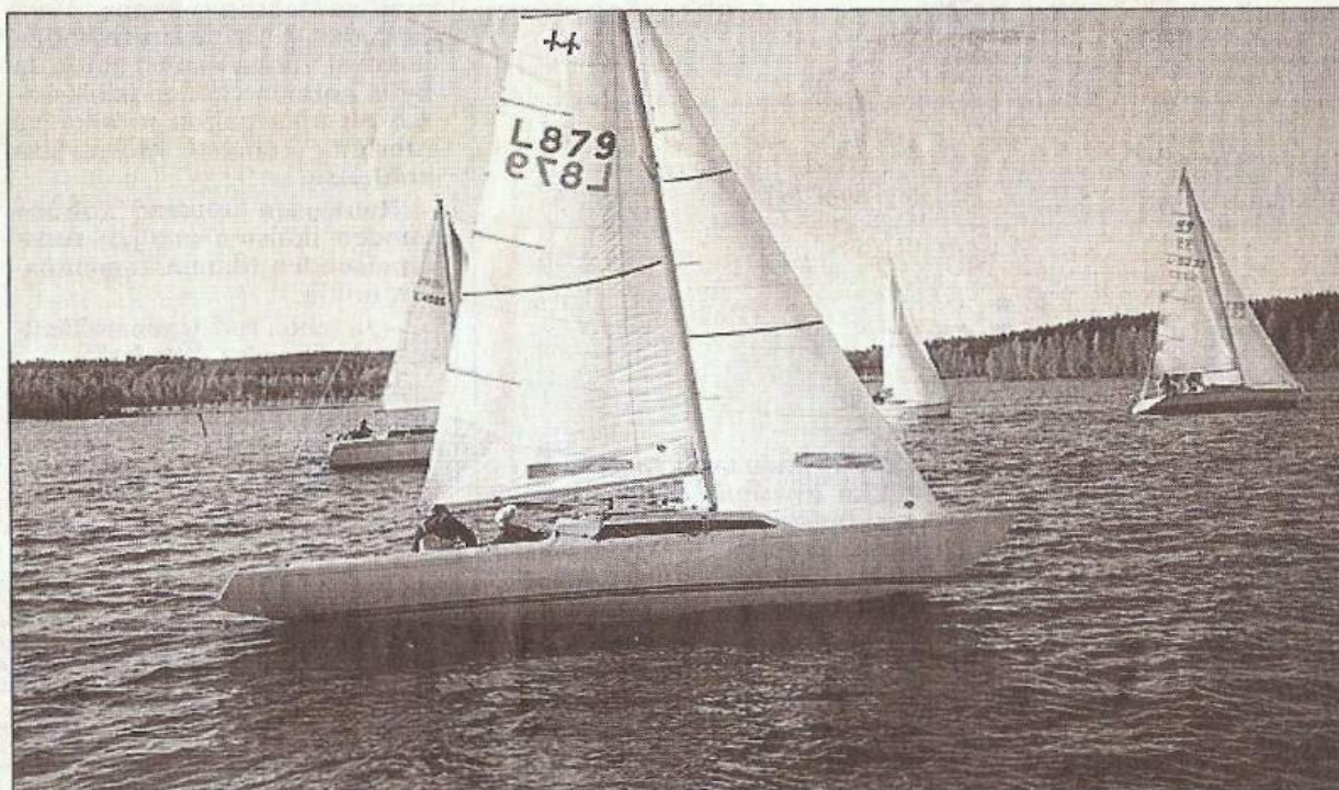
Pursiseuralaisia lähtee seilaamaan Turkkiin. Kuva Kumpeli-regatasta.

Heinolan Pursiseuran menestys Päijänteen purjehduski-soissa on ollut venekannan kokoon verrattuna mainiota.